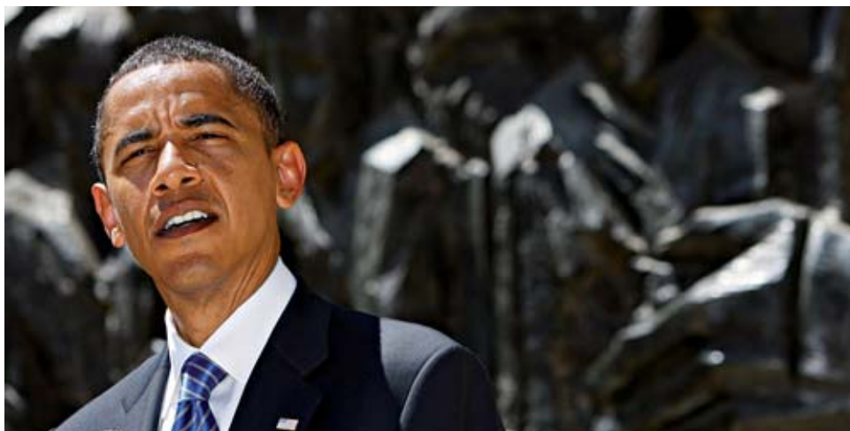
EM TODAS AS FRENTESS

Visitou seis chefes de Estado do Médio Oriente em quatro dias. Candidato democrata reúne com mais três na Europa