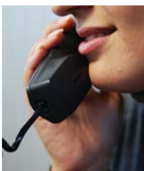
VOZ AMIGA EM LINHA

Portugal vai ter a funcionar a partir de amanhã o número único europeu (116000) gratuito para a comunicação de casos de crianças desaparecidas, anunciou o responsável da linha SOS Criança. A criação de um número único é uma das medidas integradas na estratégia europeia para defender os direitos das crianças apresentada em Julho de 2006 e que recebeu a aprovação da Comissão Europeia.