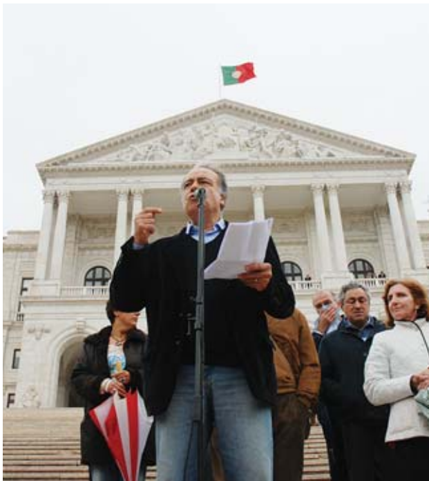
DO AVESSE LUÍS ANICETO

O Executivo mantém a incompatibilidade do desempenho de cargos de direcção em sindicatos e partidos no novo Código de Trabalho e estende-a a associações patronais