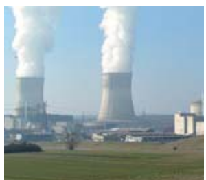
DE SETÚBAL PARA O MUNDO

de 18 milhões de euros, para a Irlanda no valor de cinco milhões e para a Grécia no valor de 11 milhões de euros.