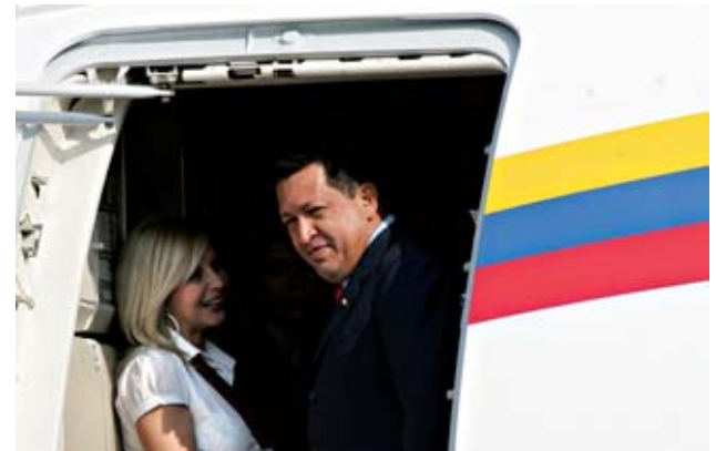
PEPE RÁPIDO