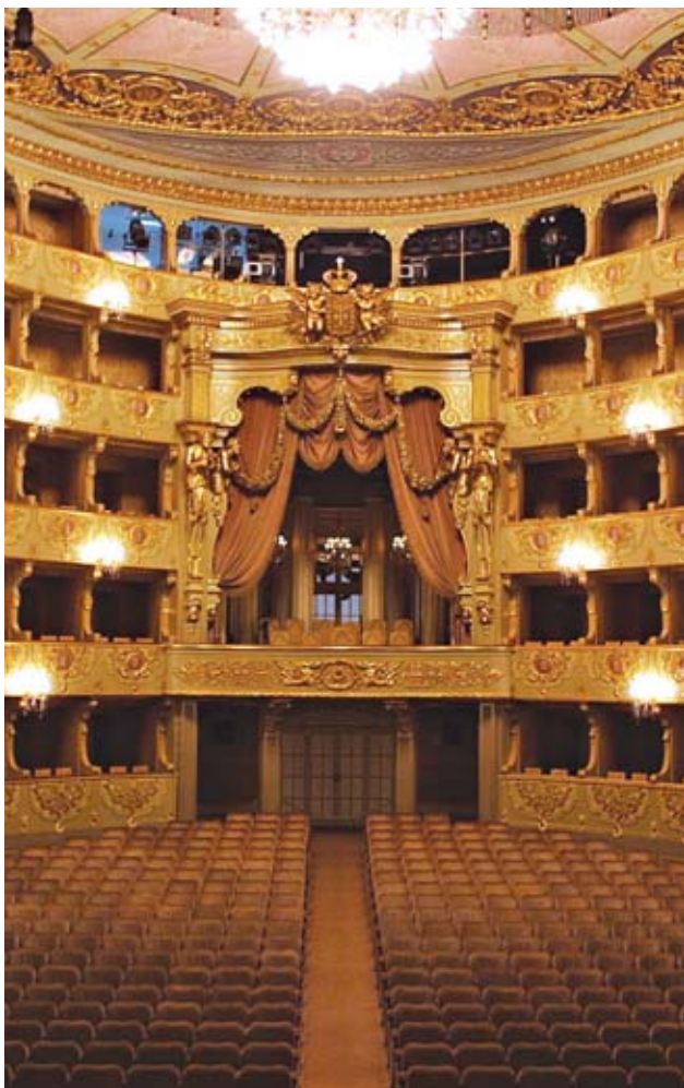
O Teatro São Carlos quer continuar a captar e a formar novos públicos

Destaques. Várias encenações contemporâneas de grandes obras do repertório artístico, com recurso a maestros, encenadores e cantores de prestígio internacional, vão figurar na temporada a iniciar já em Setembro, podendo destacar-se, por exemplo, Siegfried , a segunda jornada de O Anel do Nibelungo , de Wagner, ou Fidelio , de Beethoven, em versão concerto sinfónico. Para repetir estarão, entretanto, as extraordinariamente bem recebidas matinés para as famílias, as óperas para crianças e os recitais com entrada livre.