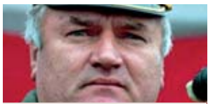
CARA COM POUÇOS AMIGOS

A Sérvia está a ser pressionada para empenhar todos os esforços para capturar Radko Mladic, o comandante do exército sérvio da Bósnia, à frente da campanha genocida que vitimou quase